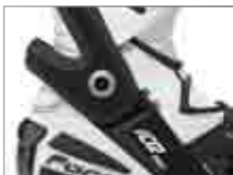
F.C.S. Flex Control System

HOHE SICHERHEIT DURCH GELENK MIT ÜBERDEHNSCHUTZMATERIAL: starkes Lorica, Protektoren an Schien-/Wadenbein, Knöchel, Ferse, Zehen. SOHLE: Öl-/Benzinresistent, verstärkte Fersenpartie. INNENFUTTER: atmungsaktives Mesh-Futter, Memory-Foam Polsterung, antibakterielle Komfort-Einlegesohle, austauschbar. AUSSTATTUNG: Ratschen-Verschluss hinten, Reißverschluss an der Innenseite, verstellbares Ristband, verstellbare Belüftung, Schalthebelverstärkung, Zehenschleifer aus Metall, austauschbar, FLEX CONTROL SYSTEM, CE-geprüft. (Ice Flow mit gelochten Einsätzen für erhöhte Atmungsaktivität.) GRÖSSEN: 38-47