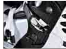
Flex-Zone aus PU