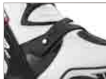
Frontverschluss zum wechseln