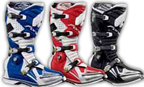
Blau/Weiß, Art. 510026BL

DOMINATOR COMP RESTYLED Weiß, Art. 510026WH