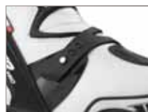
Frontverschluss zum wechseln