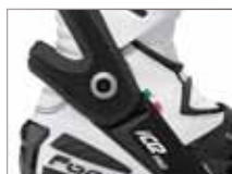
F.C.S. Flex Control System

HOHE SICHERHEIT DURCH GELENK MIT ÜBERDEHNUNGSSCHUTZMATERIAL: starkes Loric, Protektoren an Schien-/Wadenbein, Knöchel, Ferse, Zehen. SOHLE: Öl-/Benzinresistent, verstärkte Fersenpartie. INNENFUTTER: atmungsaktives Mesh-Futter, Memory-Foam Polsterung, antibakterielle Komfort-Einlegesohle, austauschbar. AUSSTATTUNG: Ratschen-Verschluss hinten, Reißverschluss an der Innenseite, verstellbares Ristband, verstellbare Belüftung, Schalthelverstärkung, Zehenschleifer aus Metall, austauschbar, FLEX CONTROL SYSTEM, CE-geprüft. (Ice Flow mit gelochten Einsätzen für erhöhte Atmungsaktivität.) GRÖSSEN: 38-47